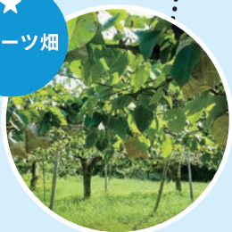
梨や柿の畑の中に農園直売所が立ち並ぶ。