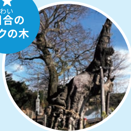
樹齢約800年、高さ約20m、周囲約7.8mの市内で一番の大きな木。 [県の指定天然記念物]