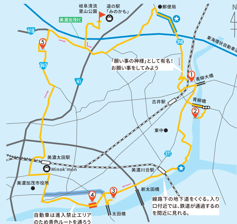
線路下の地下道をくぐる。入り口付近では、鉄道が通過するのを間近に見れる。 自動車は進入禁止エリアのため青色ルートを通ろう